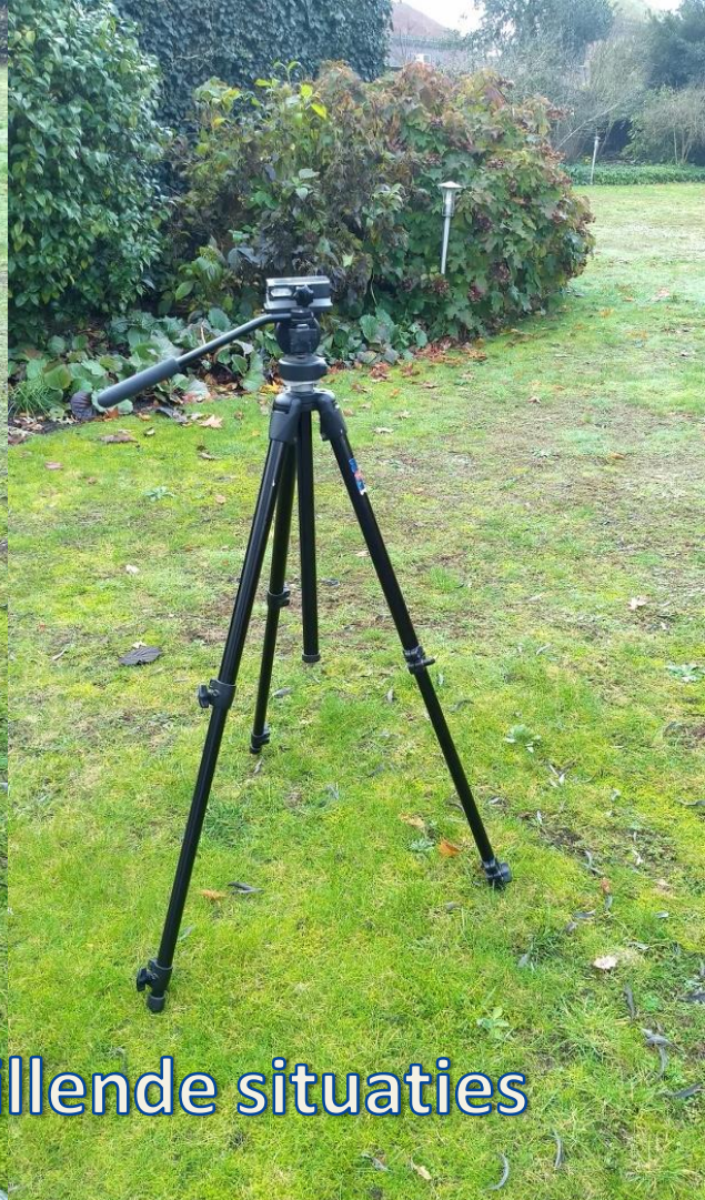
Verschillende statieven voor verschillende situaties